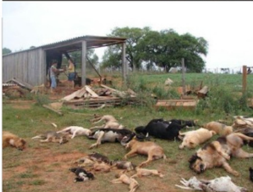
Cães mortos por defenderem seus donos no Pinheirinho

Uma imagem de cães mortos durante a desocupação do terreno do Pinheirinho, em São José dos Campos/SP, no dia 22 de janeiro deste ano, chocou o País. A foto foi publicada por diversos sites na internet e causou revolta de integrantes de ONGs defensoras dos animais espalhadas pelo mundo. Os cães foram assassinados quando defendiam seus donos contra os policiais militares que cumpriam mandado de reintegração de posse expedida pela justiça paulista.