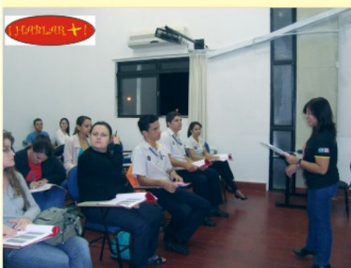
Bom número de alunos participam dos cursos

respectivamente, os cursos de idiomas qualificam o profissional comerciário para o mercado de trabalho em geral, possibilitando, inclusive, a melhora do currículo desses trabalhadores.