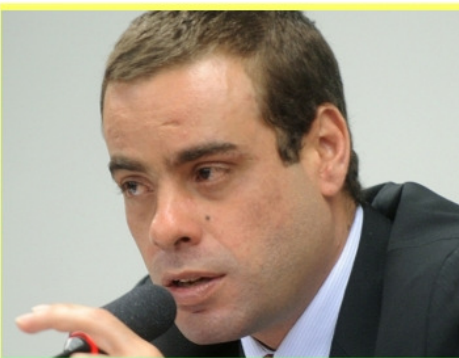
Ministro Brizola Neto: analisando o processo