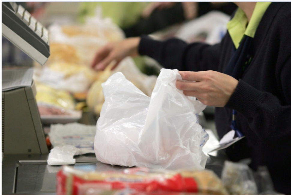
Os supermercados deverão colocar pelo menos um empacotador para cada três caixas.

A Comissão de Desenvolvimento Econômico, Indústria e Comércio realizou audiência pública para discutir um Projeto de Lei do deputado Vicentinho (PT-SP), que proíbe o caixa de supermercado de