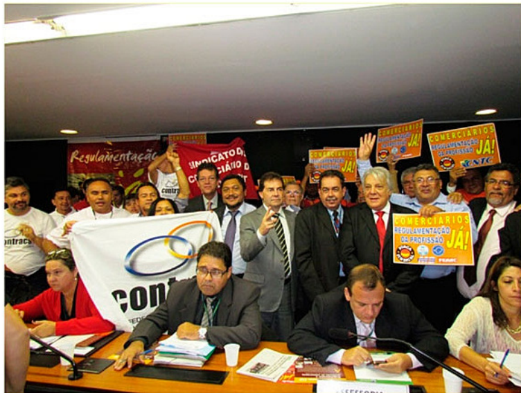
Sindicalistas e parlamentares comemoraram aprovação no Senado

O Plenário do Senado aprovou o texto final do projeto de lei que regulamenta a profissão de comerciário. A matéria segue agora para sanção presidencial. A proposta do senador Paulo Paim (PT-RS) já havia sido aprovada no Senado, mas voltou ao exame dos senadores por ter recebido três emendas em sua tramitação na Câmara dos Deputados. O texto originalmente aprovado no Senado determina que a atividade ou função desempenhada pelos empregados do comércio venha especificada na carteira de trabalho, fixa a jornada de trabalho em oito horas diárias e 44 semanais e estabelece que a contribuição para o custeio da negociação coletiva não seja superior a 12% ao ano e 1% ao mês do salário do trabalhador.