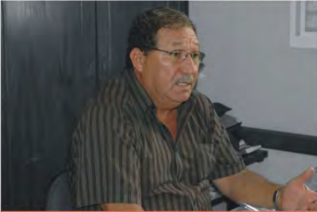
Ser comerciante ou comerciário em Patos de Minas está se tornando profissão de risco.

A onda de violência que vem ocorrendo em Patos de Minas nos últimos meses tem assustado os cidadãos do município. Alvo preferencial dos bandidos, o comércio em geral da cidade se sente acuado devido à grande quantidade de assaltos praticados. Tanto os comerciantes, quanto os comerciários estão apreensivos com esse tipo de crime, principalmente nesta época do ano, quando circula grande quantidade de dinheiro e as lojas quase sempre estão cheias. "Sinto calafrios quando vejo alguém suspeito entrar no estabelecimento onde trabalho", comentou uma caixa de supermercado que não quis se identificar por receio de represálias. Ela conta que já foi alvo dos bandidos por mais de uma vez e que sente muito medo quando acorda para ir ao trabalho. "É desconfortável conviver com esta situação", desabafa.