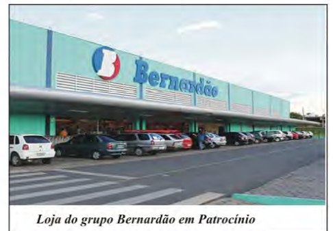
Loja do grupo Bernardão em Patrocínio