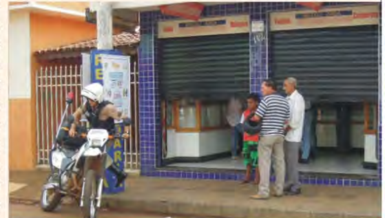
Joalheria foi alvo de assaltantes por duas vezes num curto espaço de tempo